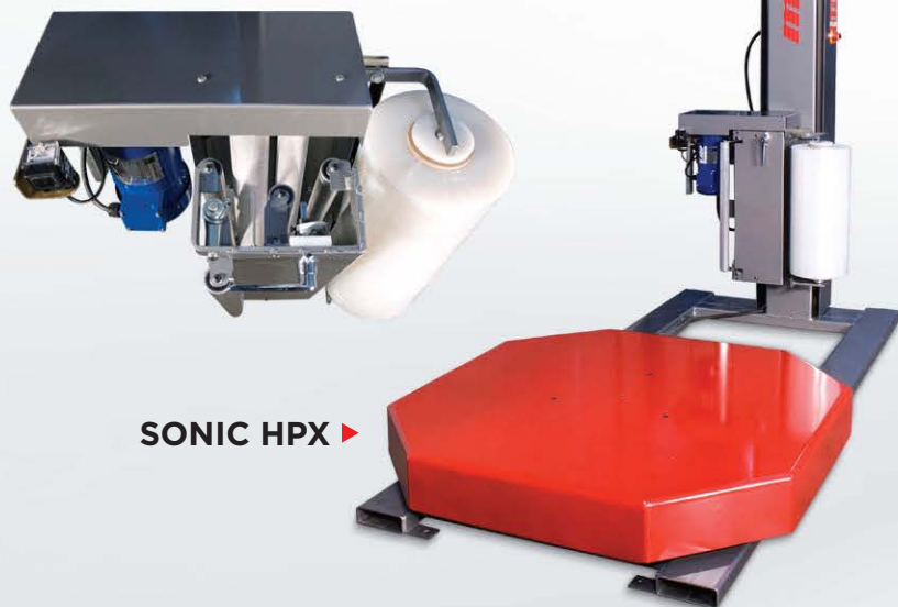
SONIC HPX ▶

Le chariot à pellicule X-Stretch procure une incroyable économie de pellicule et un emballage légendaire