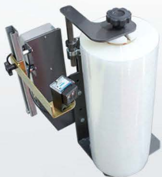
ROCKET LP ▶