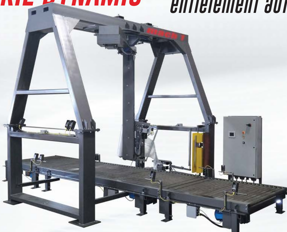
◀ DYNAMIC RTX

MODÈLE DÉMONTRE SANS CLOTURE DE SÉCURITÉ